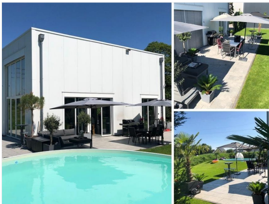
mediterranes Flair im Garten